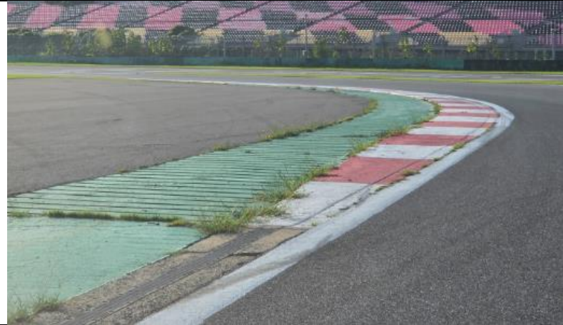
T7~T8 좌측 연석