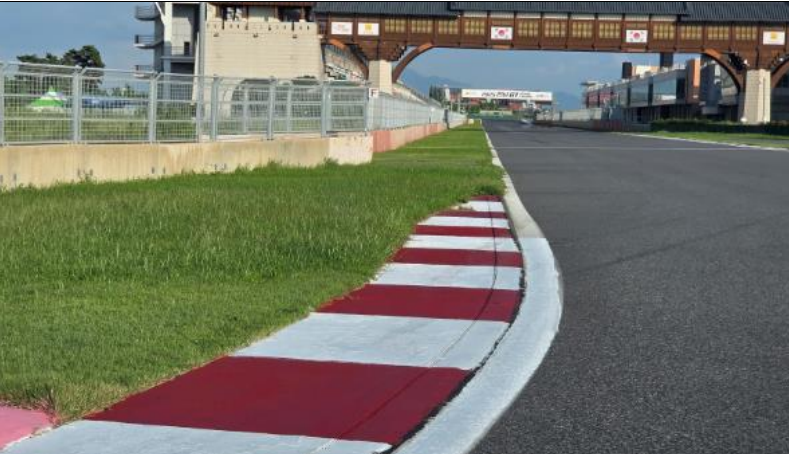
T18 연석 후 잔디 주의