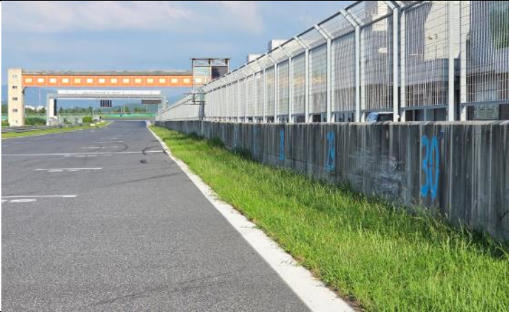
상설 피트월 하단